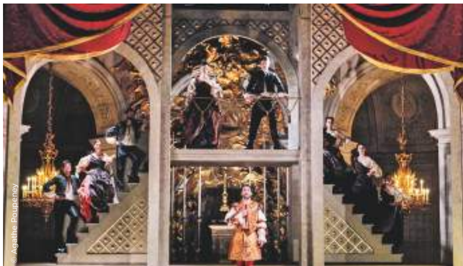
David et Jonathas de Marc-Antoine Charpentier, à la Chapelle Royale (2022) - Production de l'Opéra Royal