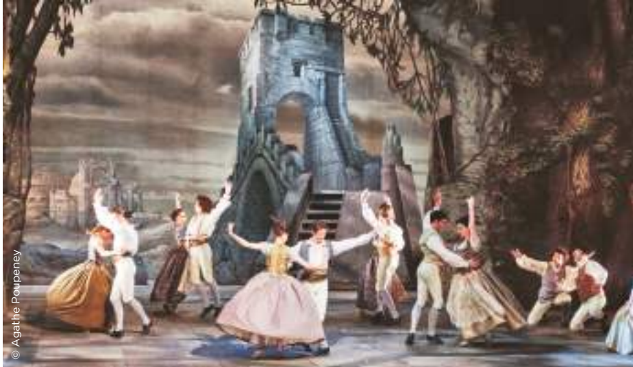
Richard Cœur de Lion d'André Grétry, à l'Opéra Royal (2019)