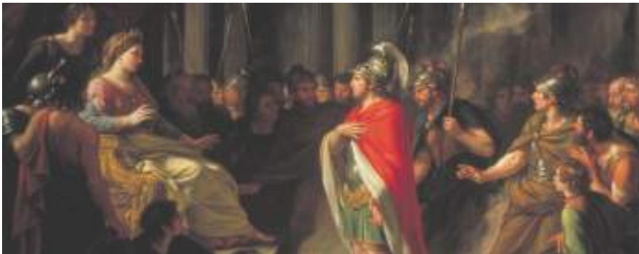
La rencontre de Didon et Énée. Nathaniel Dance-Holland (1766)

Lorsqu'Énée vient annoncer à Didon qu'il doit la quitter pour obéir à l'ordre divin, elle le rejette et lui reproche de l'avoir trompée. Énée décide alors de braver les dieux et de désobéir à Jupiter. Hors d'elle, Didon le renvoie. Après son départ, elle demeure entourée par Belinda et sa cour, et s'abandonne à la mort (lamento « When I am laid in earth »).