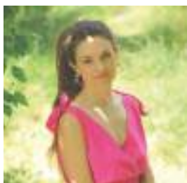
Louise Roulleau - Soprano