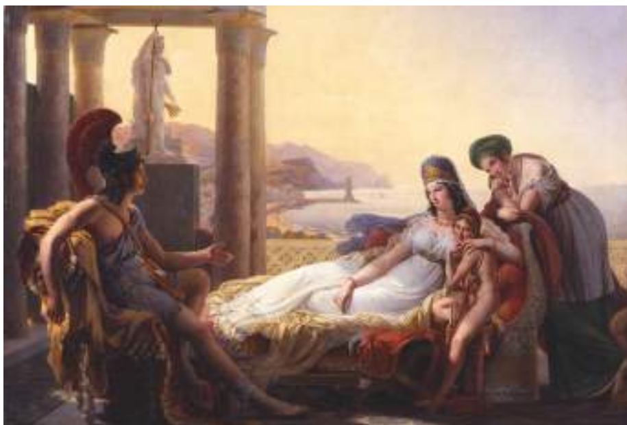
Énée racontant à Didon les malheurs de la ville de Troie. Pierre Narcisse Guérin (1815)