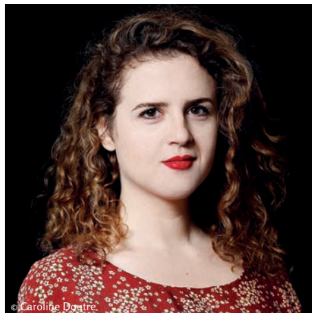
EVA ZAÏCIK Fiammetta et Fichetto, mezzo-soprano