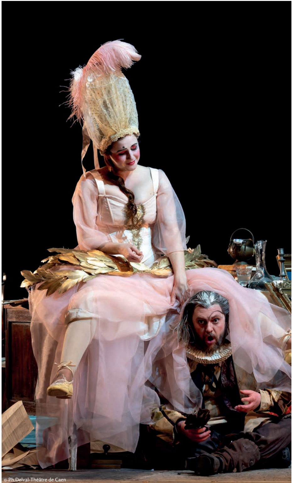
© Ph. Delval - Théâtre de Caen